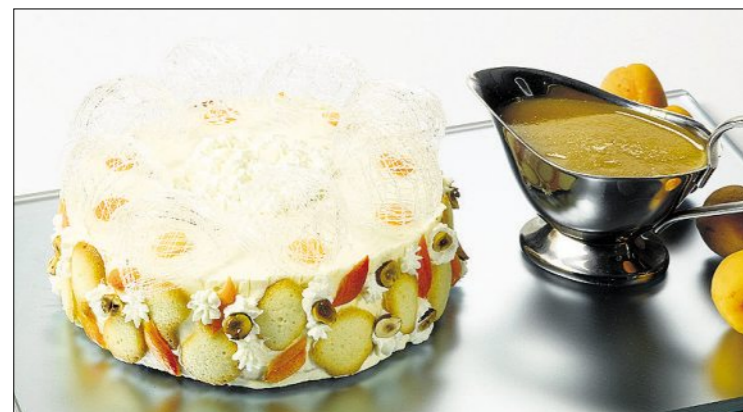
«Hinter Gittern» heisst Corina Steigers Torte aus Biskuitteig, weisser Schokoladenmousse, Haselnussglace und Aprikosensorbet.