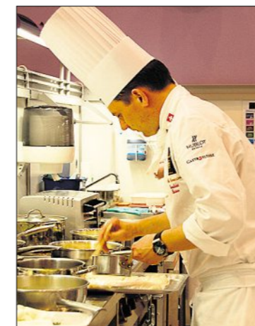
Die Nummer zwei von Philippe Rochat konzentriert an der Arbeit.

Heilbutt und eine mit Schweizer Kalbfleisch mit je zwei Garnituren zuzubereiten. Jede Platte musste mit zwölf Portionen auf dem Teller angerichtet werden. Das Publikum im Saal heizt die Stimmung an, Fo-