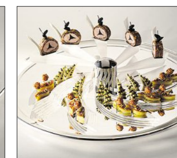
Die Fleischplatte unseres Finalisten mit Schweizer Kalbfleisch.