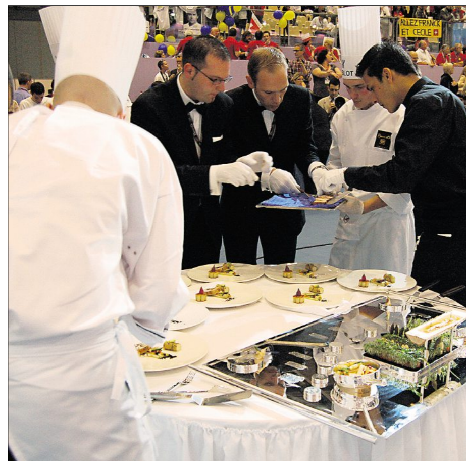
Der heikle Moment des Anrichtens: die Restaurationsprofis müssen zwölf identische Teller hinbringen, ohne die zarten Kreationen zu zerstören und es muss schnell gehen, damit die Gerichte noch warm bei der Jury ankommen; Instruktionen der Köche oder Fotos helfen dabei.