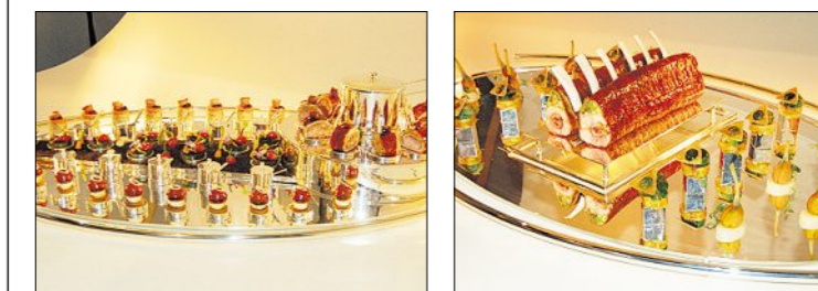
Jede Finalisten-Platte mit zehn Portionen des Gerichts (zwei Portionen werden separat direkt auf Tellern angerichtet) wird vor der Jurierung schnell fotografiert. Eine Gelegenheit, die Gerichte näher zu betrachten.