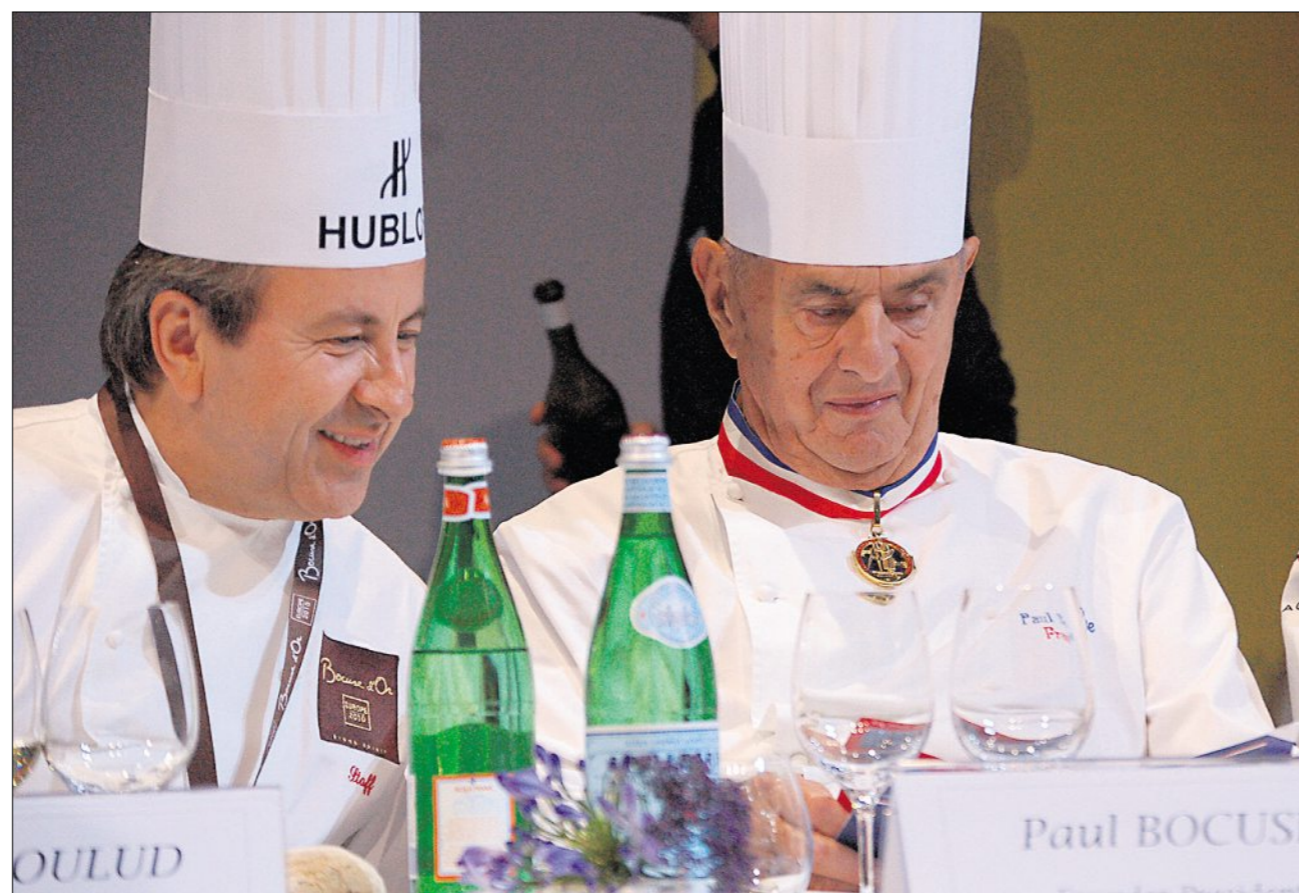
Paul Bocuse (rechts) ist zur europäischen Ausscheidung «seines» Wettbewerbs in die Schweiz gereist. Die Ikone der französischen Gastronomie lancierte den Wettbewerb 1987. Links von ihm Jurypräsident Daniel Boulud, der kurzfristig den ausgefallenen Starkoch Joël Robuchon ersetzen musste. Der Franzose Boulud arbeitet in den USA und organisiert auch die dortige Ausscheidung.