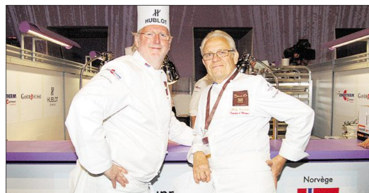
Frédy Girardet (r.), Vaterfigur der Schweizer Gastronomie und Ehrenpräsident des «Bocuse d'Or Europe 2010», posiert mit seinem norwegischen Kollegen Heyvind Hellstrom, Chef des Restaurants Bagatelle in Oslo.