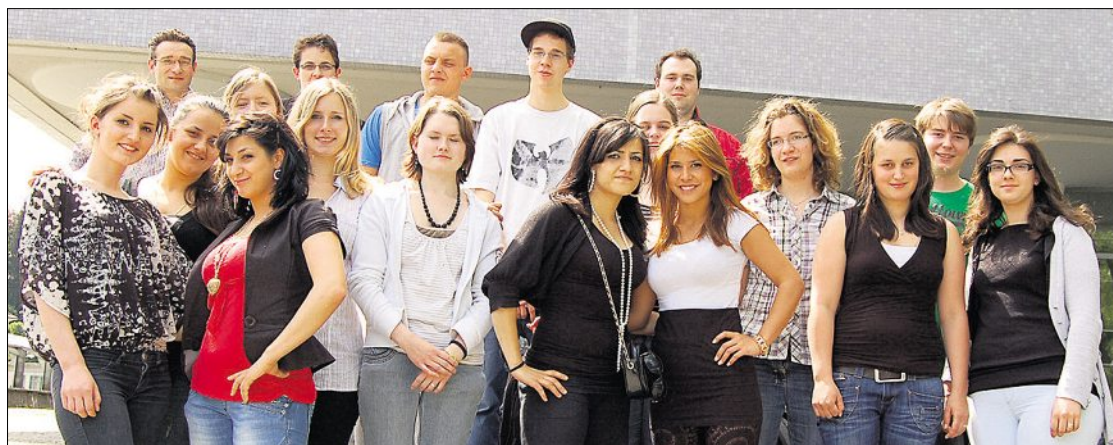
Le domande per l'inchiesta riservata agli apprendisti del settore alberghiero e della ristorazione sono state allestite dalle cinque Società professionali della Hotel & Gastro Union: Società dei cuochi, Società alberghiera-economia domestica, Società della ristorazione, Società dell'accoglienza. Più di 5000 giovani hanno risposto.

Un chilometro centotré metri e undici centimetri è la lunghezza del pane da Guinness dei primati realizzato a Modica, in Sicilia. Il pane è stato condito con olio, origano, sale e formaggio, tutti rigorosamente della zona. Diciotto i panificatori che hanno lavorato, per impastare, infornare e sfornare il pane.