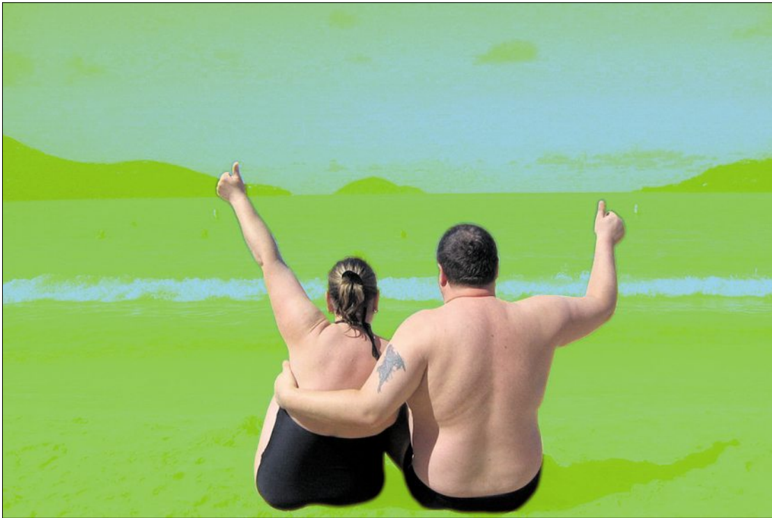
Des vacances à la mer ou en Suisse? Avec la nouvelle Convention collective nationale de travail, un grand nombre d'employées et d'employés de l'hôtellerie-restauration profiteront d'une semaine de vacances de plus.