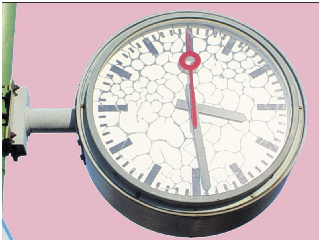
«Un buon collaboratore non guarda l'orologio», è quanto si sente dire spesso sul posto di lavoro nel nostro settore. Solo che l'orario di lavoro è regolato nel contratto collettivo CCNL ed è quindi per tutti obbligatorio.