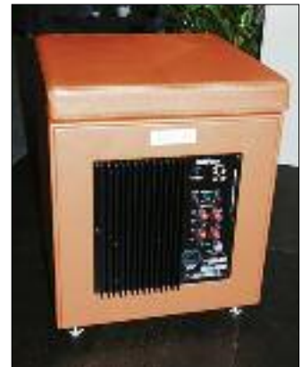
Die Musikanlage ist in den Hocker integriert.