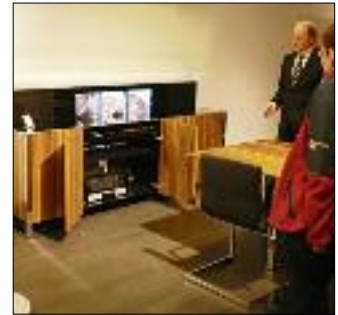
Flachbildschirme werden im Sideboard versorgt.