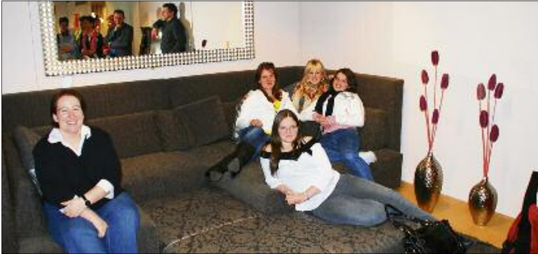
Vertreterinnen der Hauswirtschaft, Netzwerk Zürich und Zentralschweiz, bei ihrem Besuch in Volketswil. Sofa-landschaft, fläzen.